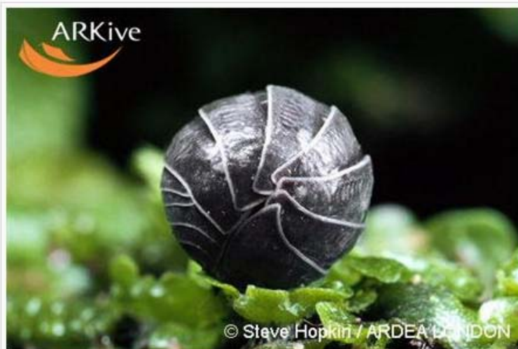
Imagen: Su primo y más conocido, el bicho bolita.

extinguieron) o una hormiga del tamaño de un caniche, pues algo así sentí.